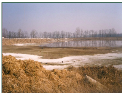
I. Medence eredeti állapot